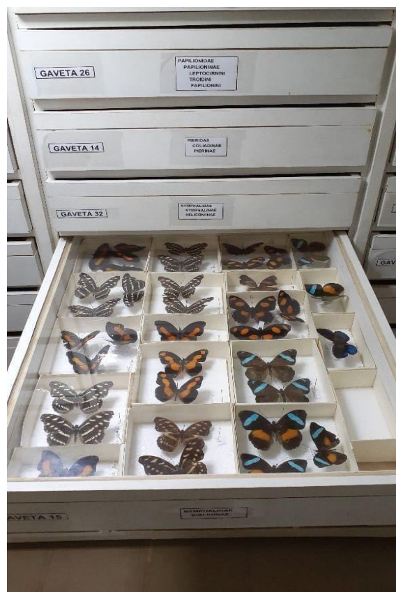
Figura 1. Borboletas depositadas em gavetas entomológicas.